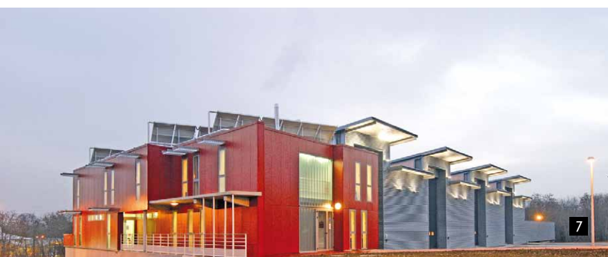
1/ Centre d'affaires Alliance - Haute-Savoie (74). Ettori-Révilon architectes.